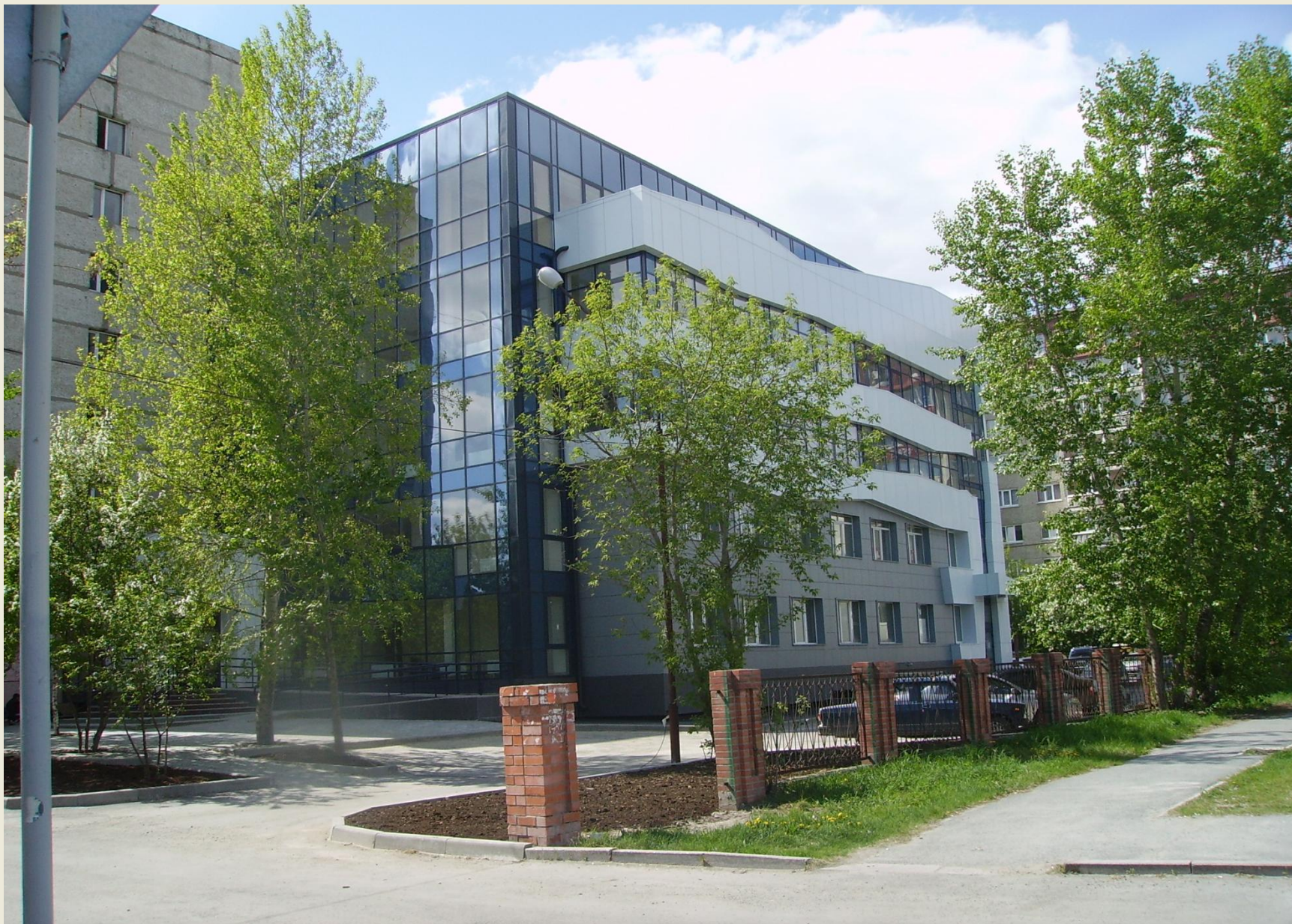
Тюменский филиал Института нефтегазовой геологии и геофизики СО РАН