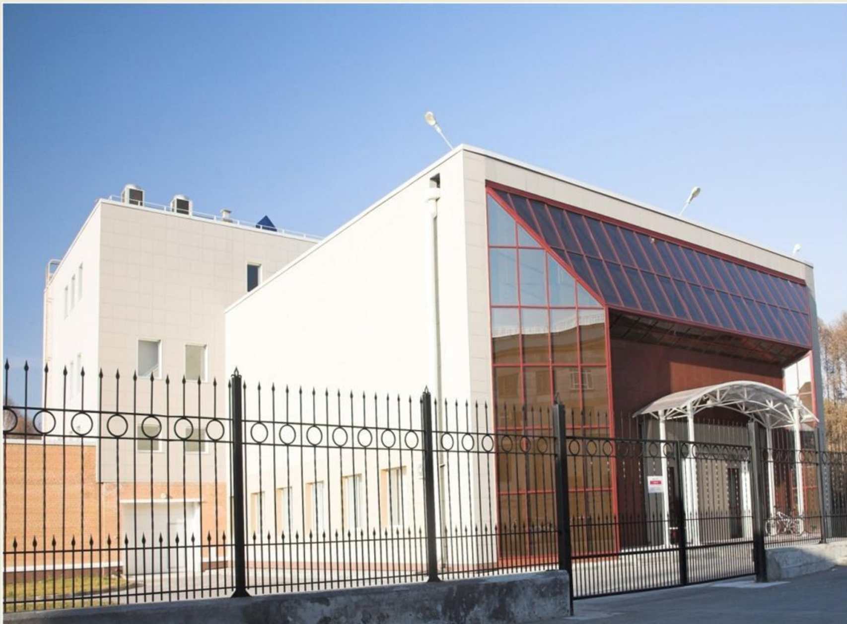
«SPF-виварий» Института цитологии и генетики СО РАН