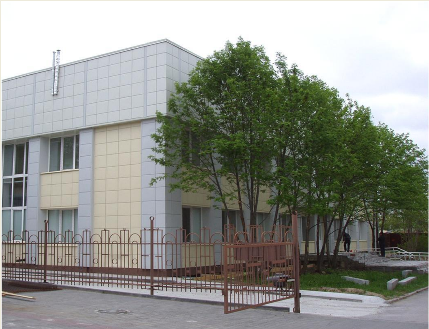
Корпус-модуль Международного томографического центра СО РАН после капитального ремонта