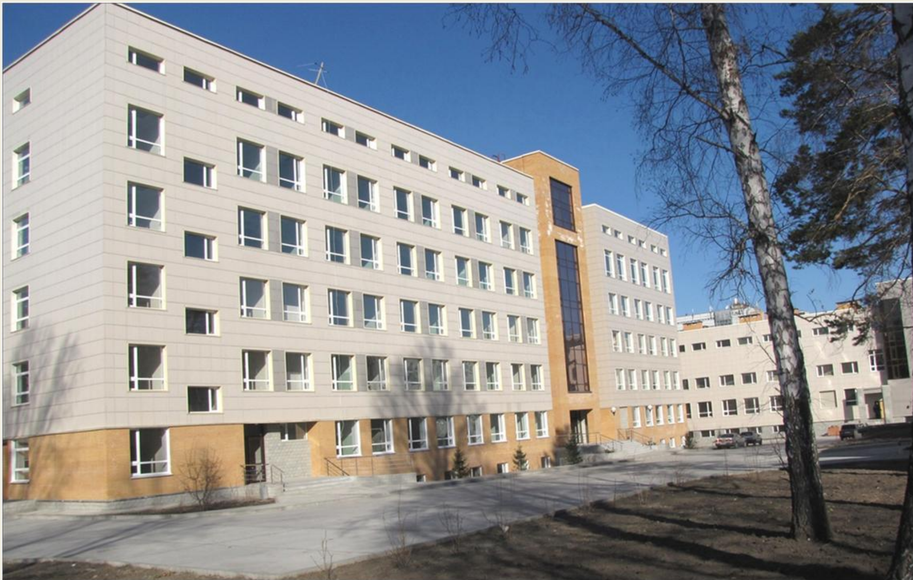
Новое здание Института почвоведения и агрохимии и Института молекулярной и клеточной биологии СО РАН в Новосибирском Академгородке