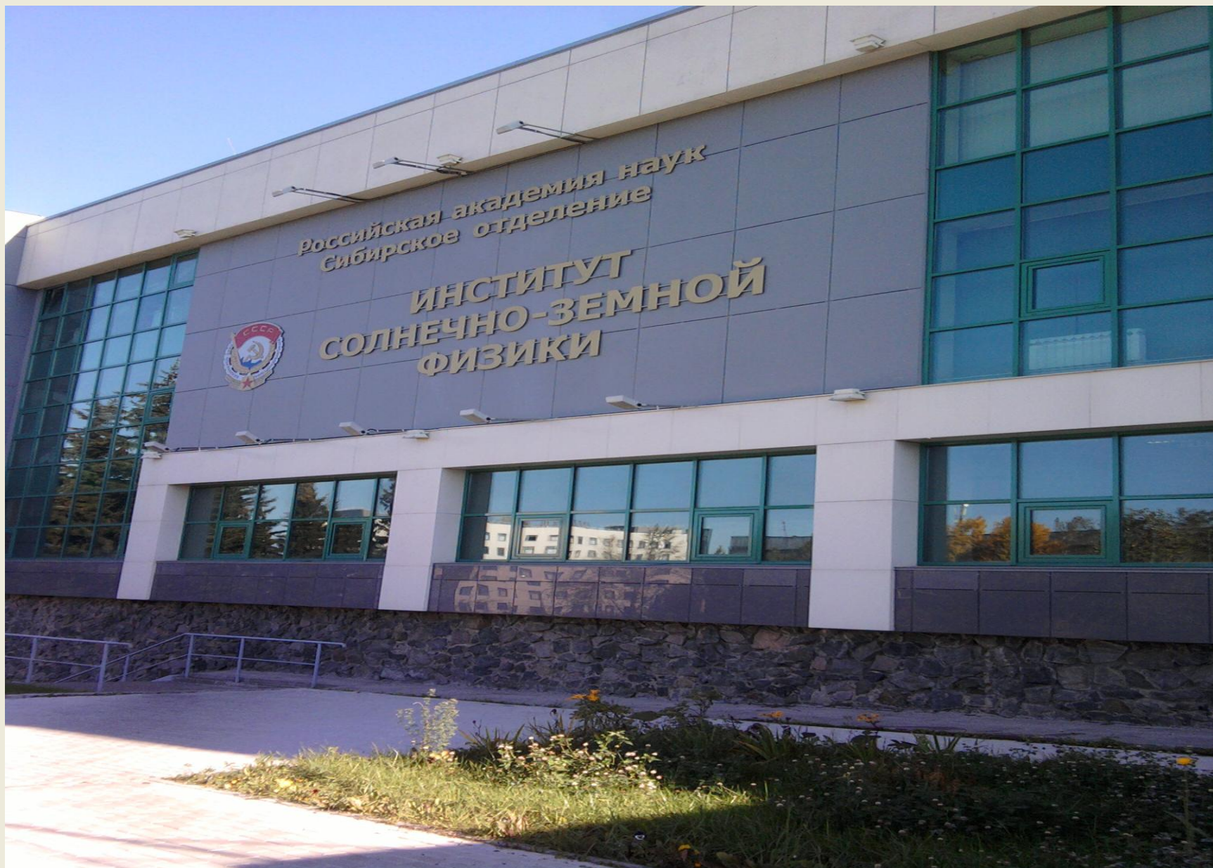
Административный корпус Института солнечно-земной физики СО РАН