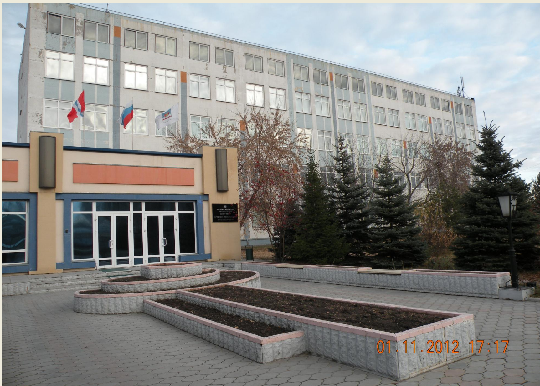
Омский научный центр СО РАН, Институт проблем переработки углеводов