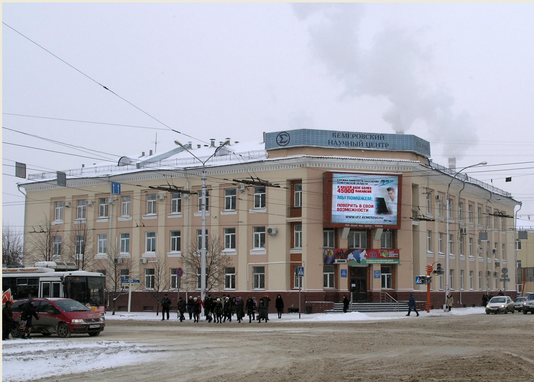
Здание Президиума Кемеровского научного центра СО РАН и Института угля